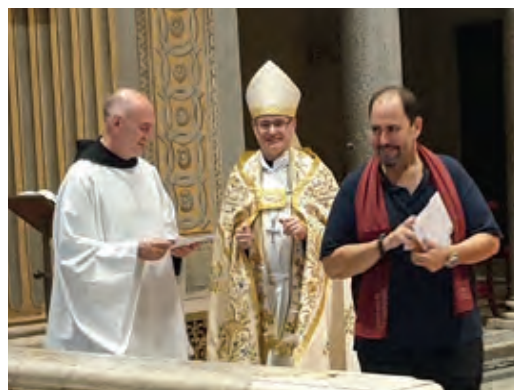
Acabant de rebre la cèdula com a confrare de la Mare de Déu de Montserrat

Vull donar les gràcies al Monestir, per haver confiat en l'Hospitalitat de la Mare de Déu de Lourdes de Barcelona, Sant Feliu de