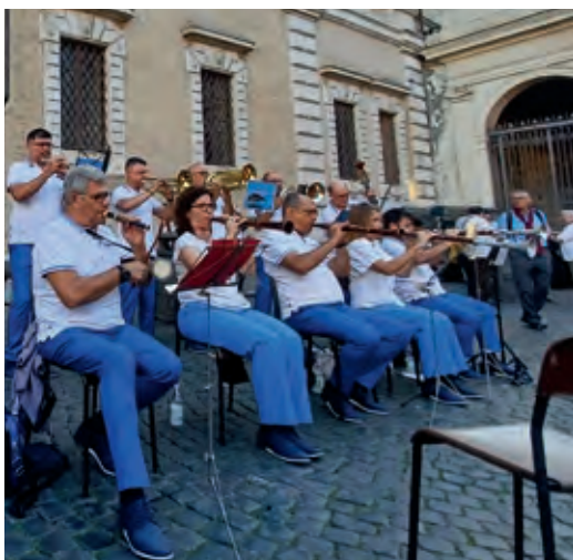
La tenora i el tamborí, en primer pla, de la Cobla Granollers van obrir el primer acte del Pelegrinatge