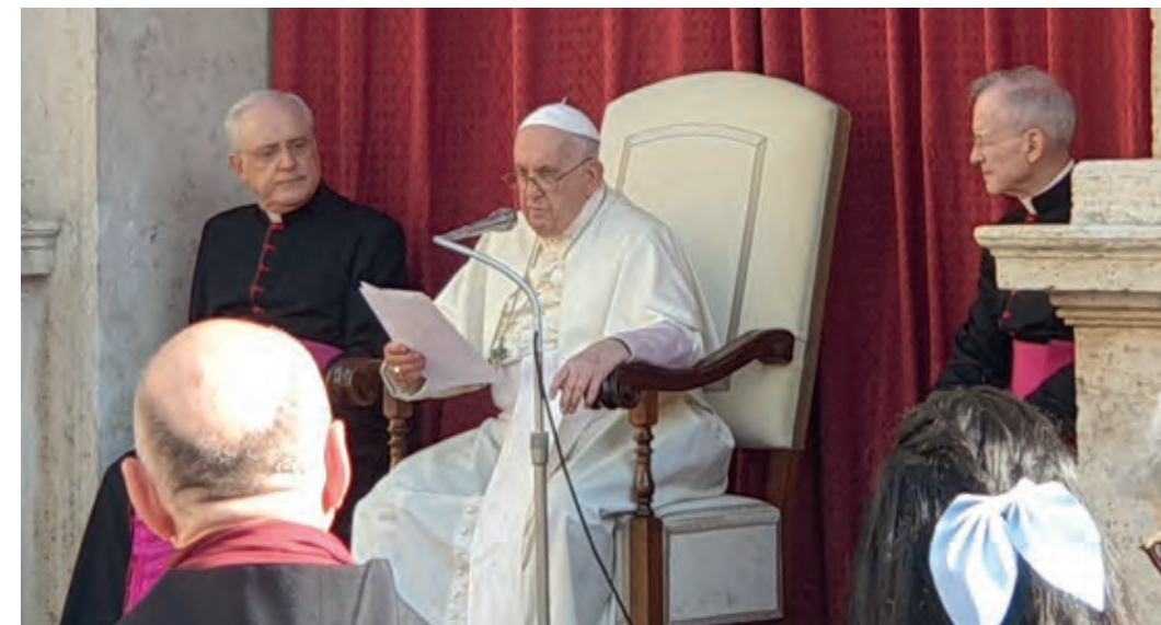
El Sant Pare Francesc adreçant-se als confreres de Montserrat