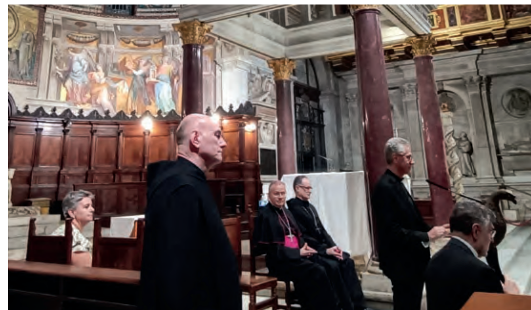
Els diferents participants en la pregària vespertina