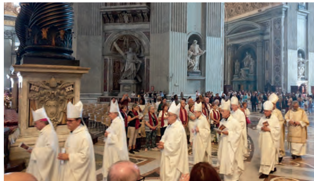
Processó dels prelats que concelebrarien l'Eucaristia