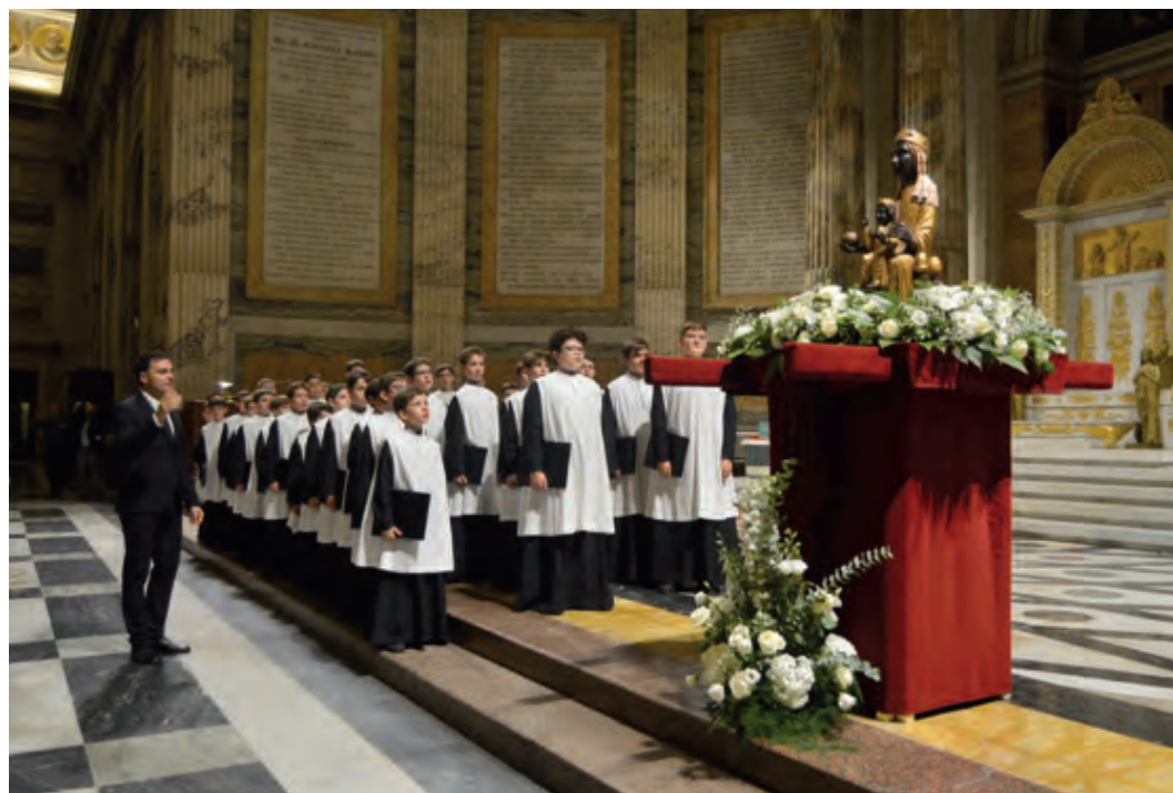
Els escolans mirant la imatge de la Moreneta gironina durant el cant del Virolai

estona per menjar-nos el pícnic. El sol ens havia cansat, i una petita ombra que vam trobar la vam agrair força. Després de dinar vam entrar fins al lloc on havíem de cantar per deixar-hi les motxilles, i de nou vam tornar a sortir amb saia, roquet i carpeta per a la processió d'entrada, que seria solemne.