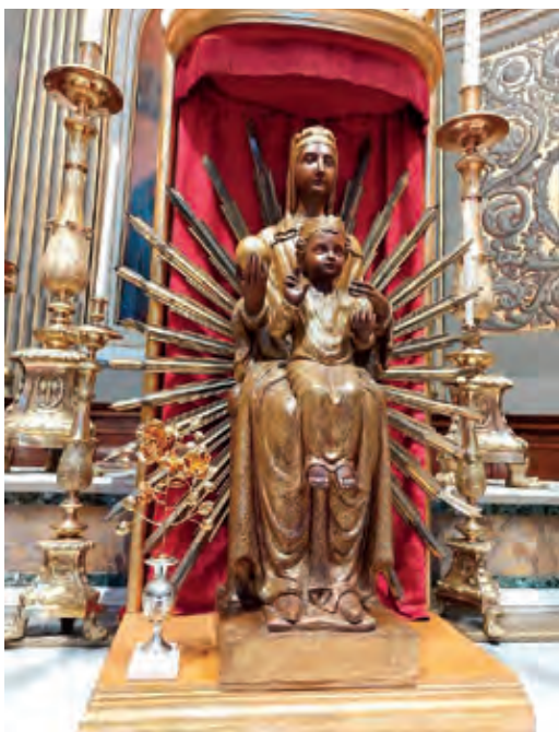
La imatge de 1950 amb la Rosa d'Or

El senyor cardenal ens deixà l'homilia escrita i ens predicà, tal com ell mateix va dir, d'allò que portava al cor. Tots els bisbes i el P. Abat dispensaren la comunió al nombrosíssim grup de fidels que es formà entre els confreres i altres pelegrins que s'uniren a la nostra festa. Acabada la missa es cantà el Virolai.