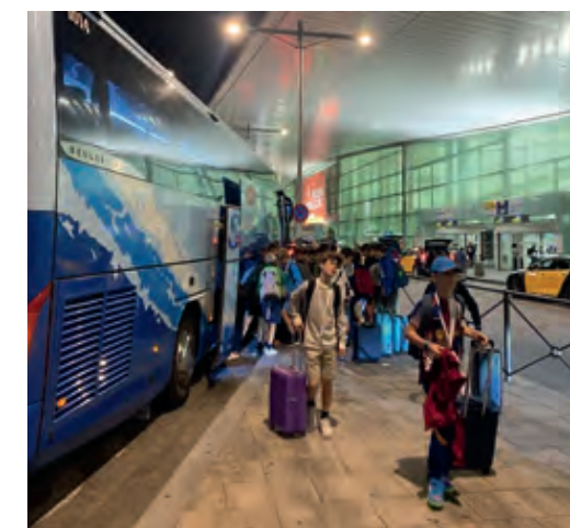
L'arribada a l'aeroport de Barcelona era la tornada a casa amb la motxilla plena d'una experiència difícilment superable.

Al vespre vam agafar el vol de tornada. Ja a Barcelona ens vam trobar amb les famílies que ens esperaven: havíem tornat a casa sans i estalvis, i no podíem fer res més que estar-ne agraïts.