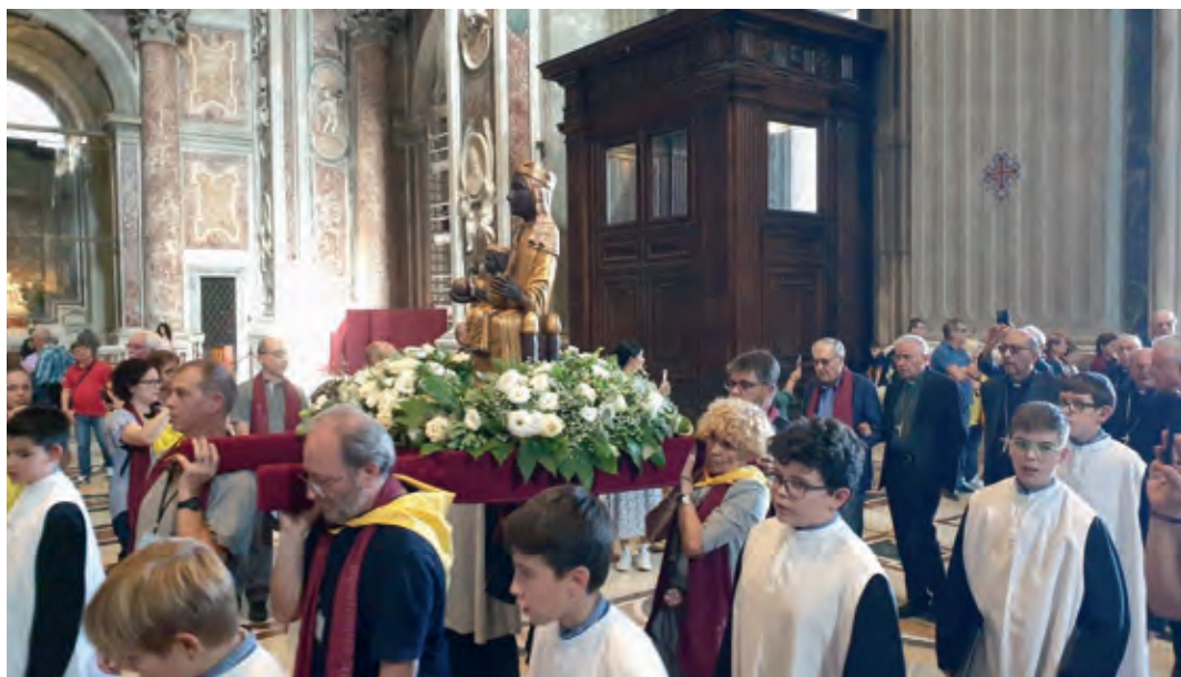
Membres de l'Hospitalitat de la Mare de Déu de Lourdes portant la Moreneta gironina

En arribar a l'altar de la Càtedra, el cardenal de Barcelona, Mons. Joan Josep Omella, recità l'oració pro Papa , es col·locà la imatge