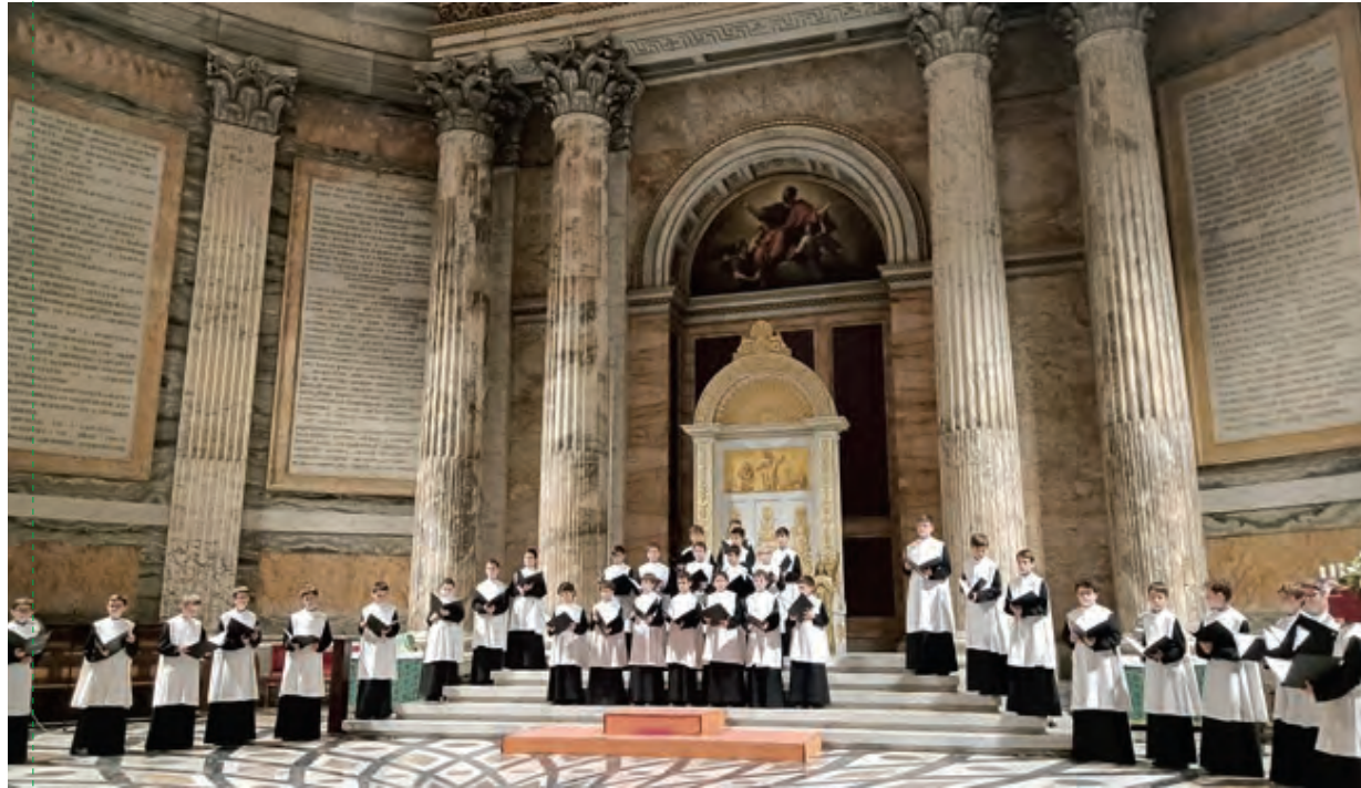
Àngelus. Plaça de Sant Pere