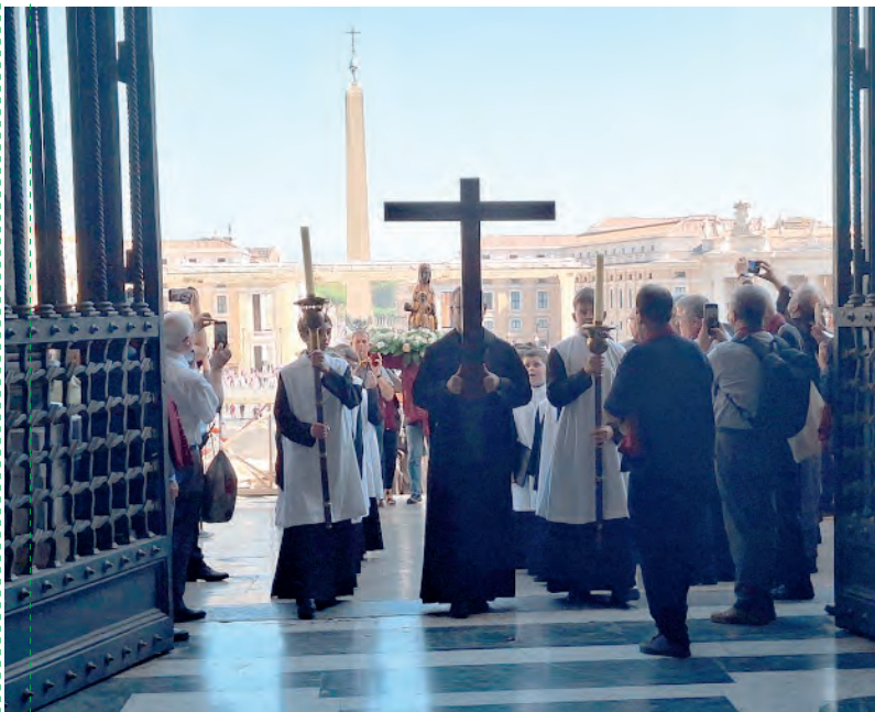
El P. Abat amb la creu d'ermità i els dos escolans amb canelobres presidien la processó

raules i una pregària centrades a demanar la pau davant del darrer conflicte a Terra Santa, que tristament se sumava al d'Ucraïna i als de tants altres llocs que ja no són notícia