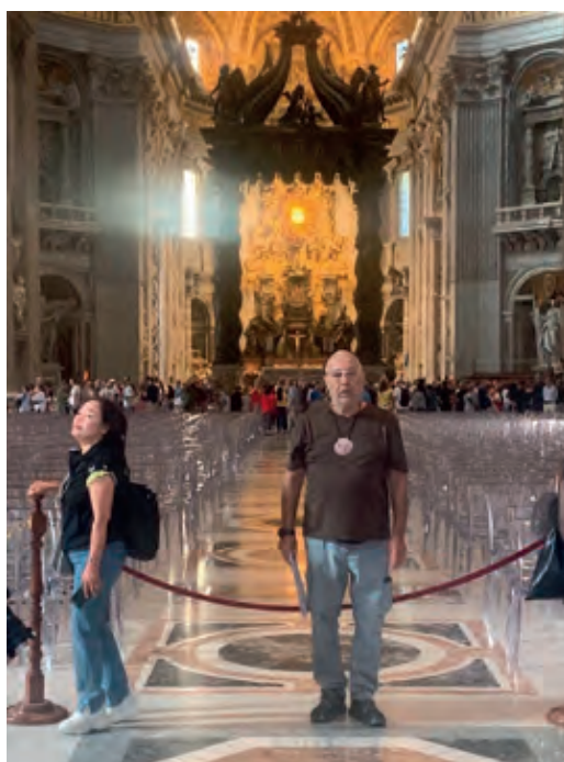
En acabar el pelegrinatge va tornar a la Basílica de Sant Pere del Vaticà

En el trajecte entre poble i poble, molts trams són antigues vies romanes, amb llam-