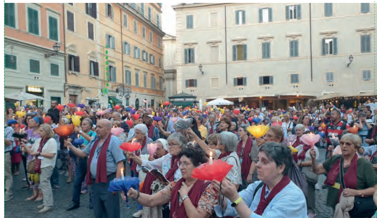
Es creà un bonic ambient a la plaça, de respecte vers els peregrins