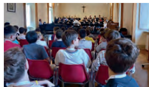
Van escoltar un assaig de la Cappella Musicale Pontifica Sistina