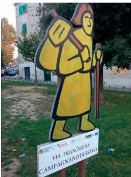
Tot i que hi ha parts no massa ben indicades altres indicacions són ben originals