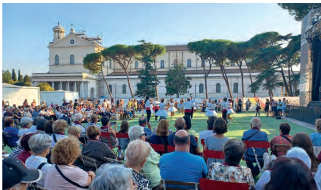
Ballada de sardanes davant de Sant Pau Extramurs

Sens dubte, aquests dies a Roma i al Vaticà han estat un dels capítols que la història de l'Obra del Ballet Popular recordarà en majúscules i que han reforçat encara més el vincle històric i sentimental que la nostra institució té amb Montserrat. Un llaç que es referma i renova cada any amb l'Aplec d'Esbarts i amb la Trobada Sardanista –dia que escoltarem de nou 'La Sardana de la Pau'– sense oblidar que vora l'altar crema sempre la llàntia del sardanisme.