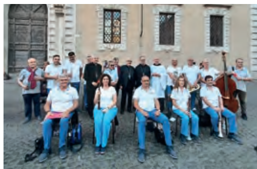
La Cobla Granollers va ser l'encarregada de tocar les sardanes en els diferents escenaris