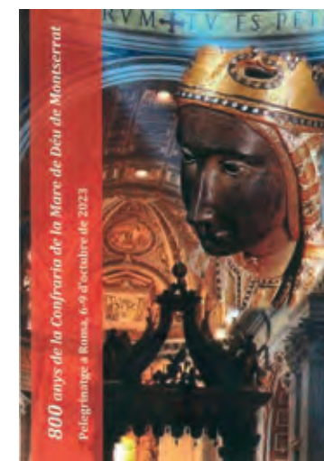
El llibre del pelegrinatge amb totes les pregàries, cànctics, horaris... de les celebracions