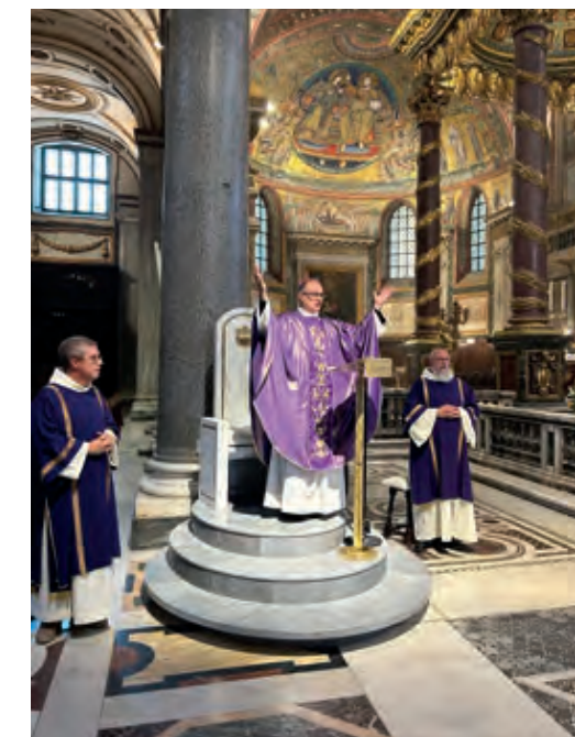
El P. Abat va presidir la missa en memòria dels confreres difunts.

Al costat esquerre de l'accés a la cripta que custodia les relíquies del pessebre hi havia la Mare de Déu de Montserrat amb la