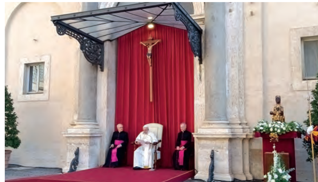
El Papa saludant els presents i donant-los la benvinguda. La medalla que es va oferir al Sant Pare

L'audiència començà amb la benedicció de la imatge de la Moreneta i amb l'ofrena de la Rosa d'Or a la Mare de Déu. El Papa ens va sorprendre amb el famós "no ha de ser en català?", que no estava pas previst en el protocol aprovat per la Casa Pontifícia.