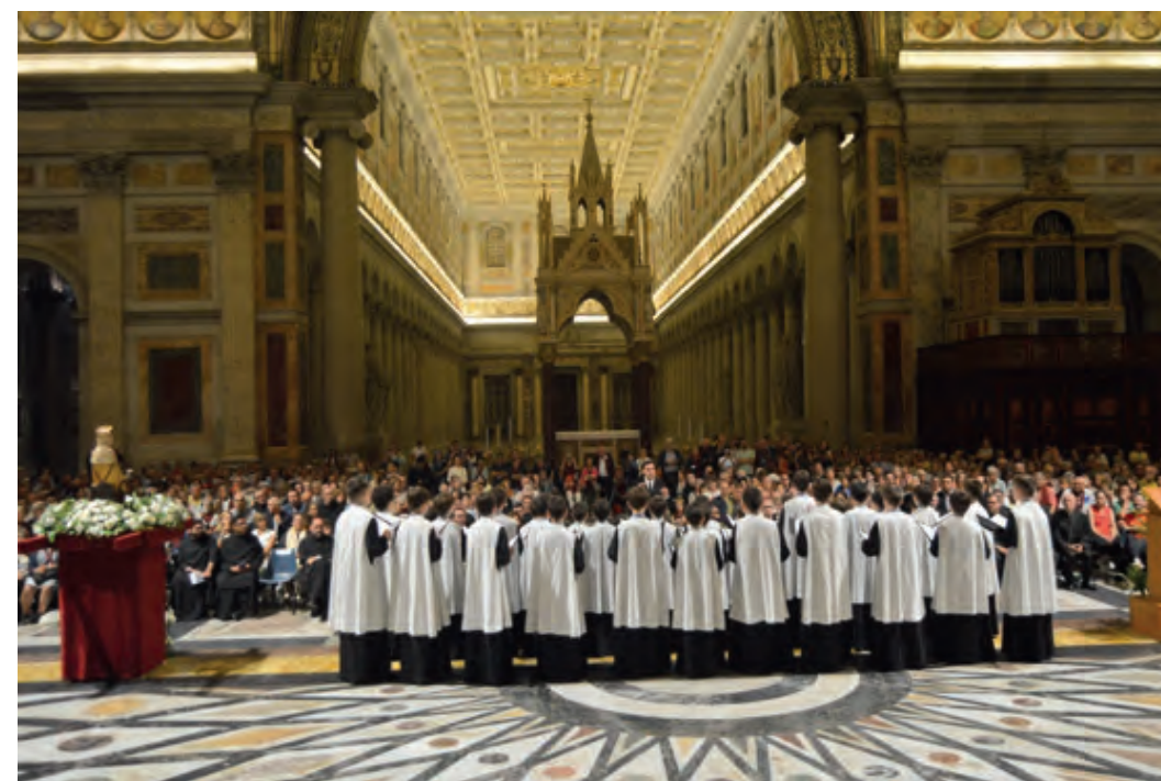
L'església es va omplir de gom a gom per escoltar l'Escolania