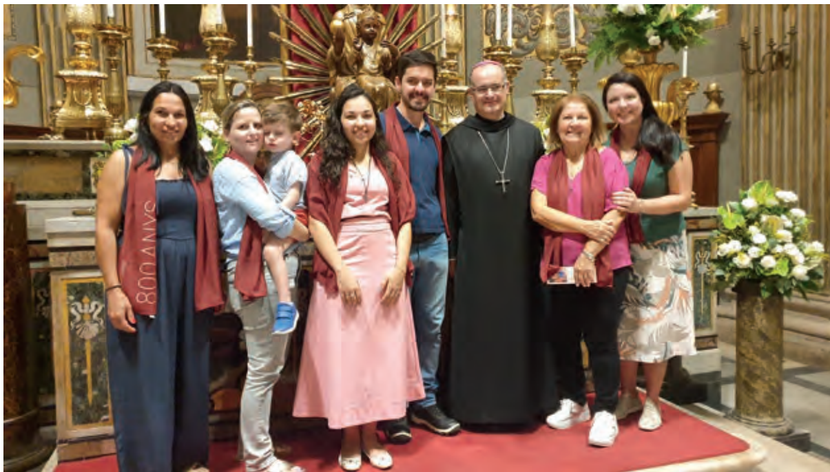
Els confreres de Sao Paulo