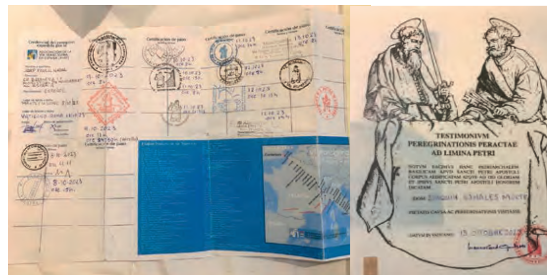
El Testimonium del Joaquim amb els segells dels llocs de pas

Vam coincidir amb un matrimoni de Dinamarca –ell catedràtic en dues Universitats– amb qui parlàvem en francès; un grup