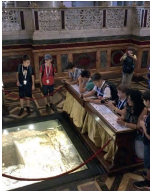
La tomba de Sant Pau

Ens va explicar moltes curiositats particulars i generals, com ara la funció de la Porta Santa, que s'obre cada 25 anys, el fet que hi hagi confessions permanents per ser un lloc important de pelegrinatge, i molts d'altres detalls que no ens és possible de recollir aquí. Però en destaquem dos: el primer, la representació dels papes, i el segon i més important, és la tomba de St. Pau. També s'hi exhibeixen unes cadenes del s. I, amb les quals va estar lligat mentre era a la presó. Vam glossar la figura de St. Pau i vam comentar també el fet que se'l representés sempre amb una espasa, no tant perquè morís decapitat, sinó per les seves mateixes paraules de la carta als Hebreus: "La paraula de Déu és viva i eficaç. És més penetrant que una espasa de dos talls: arriba a destriar l'ànima i l'esperit, les articulacions i el moll dels ossos; discerneix les intencions i els pensaments del cor." (He 4,12). Essent tanta la importància del lloc, vam pregar amb un