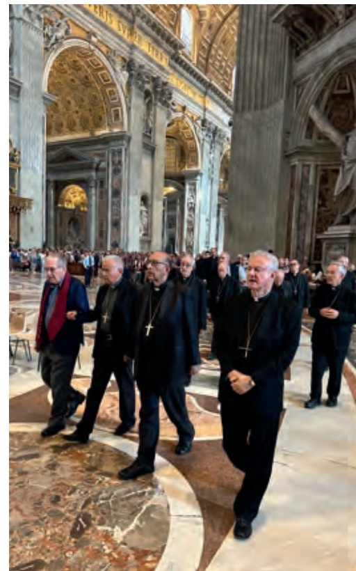
Els bisbes catalans anaven darrera de la Moreneta

de la Moreneta al costat esquerre de l'altar, i els prelats i els mossens concelebrants anaren a la sagristia a revestir-se per a la celebració de la missa.