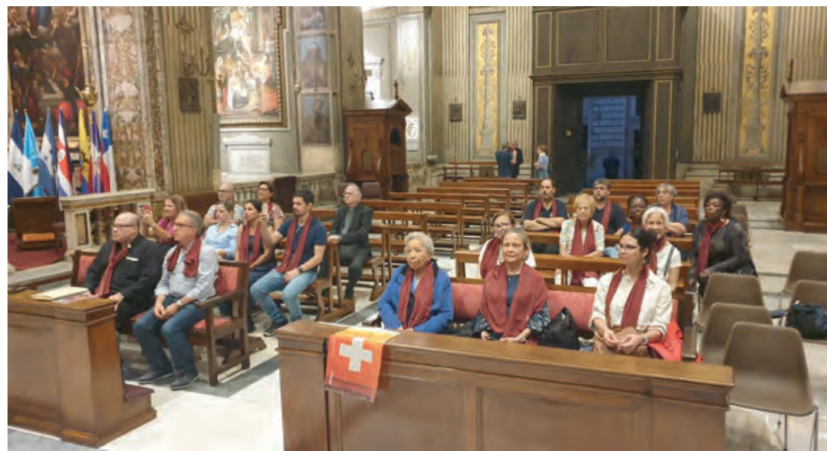
Confreres de diferents llocs de l'estranger