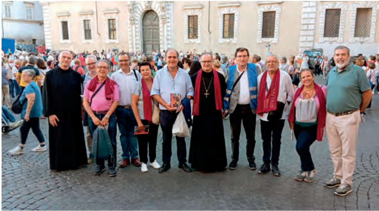
Els confreres de Sevilla