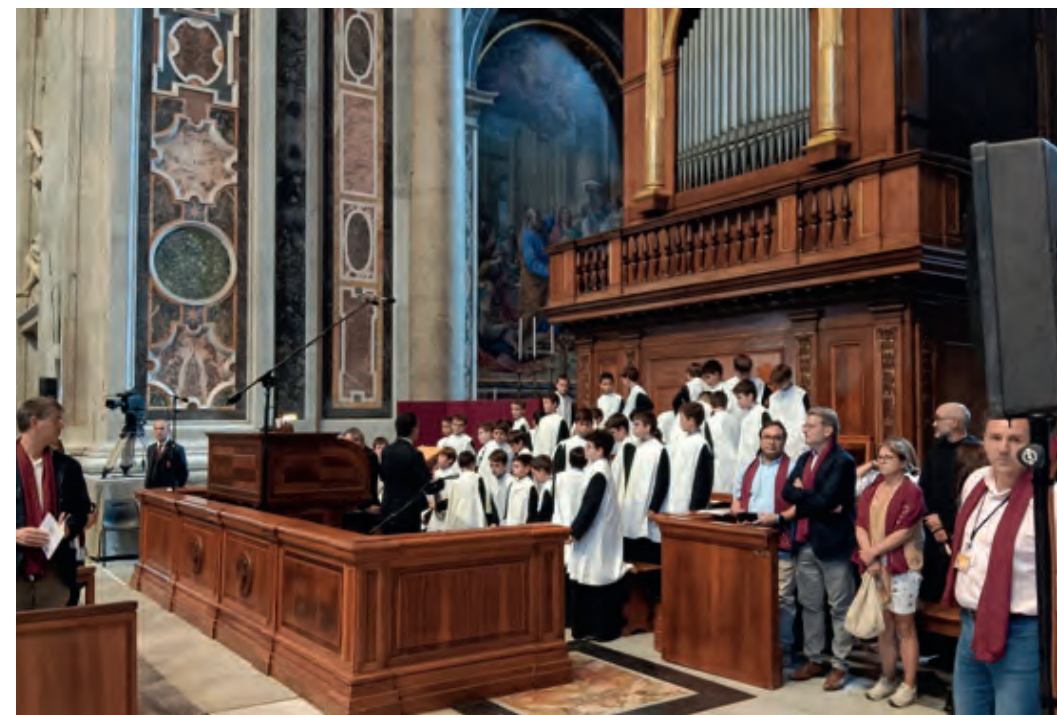
L'Escolania va ocupar en la basílica de Sant Pere del Vaticà el lloc que hi ha habitualment l'escolania del Papa

pressionar veure-la completament plena de pelegrins amb el fulard dels 800 anys, unes 1.200 persones. Havíem omplert el Vaticà!