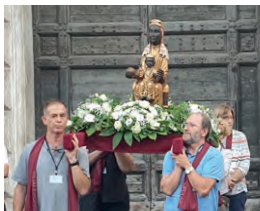
Sortida de la Moreneta de la Basílica de Santa Maria in Trastevere

El primer acte ens aplegà el divendres 6 d'octubre a Santa Maria in Trastevere. Vam