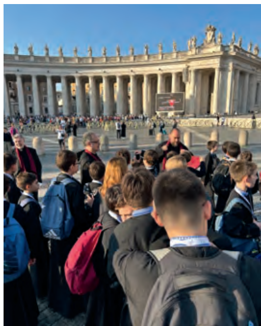
Aquesta vegada la saia va ser una bona credencial per accedir pels controls

Al final d'aquelles files hi érem els acompanyants de l'Escolania. Tots li vam poder donar la mà i a un servidor li va tocar per encàrrec de donar-li la medalla commemorativa de la Confraria, que va rebre amb atenció. I vaig aprofitar l'ocasió de tenir-lo allà per demanar-li si podia saludar els nois, que estaven asseguts just al nostre darrere. Per protocol no tocava, però no va dubtar gens a fer-ho.