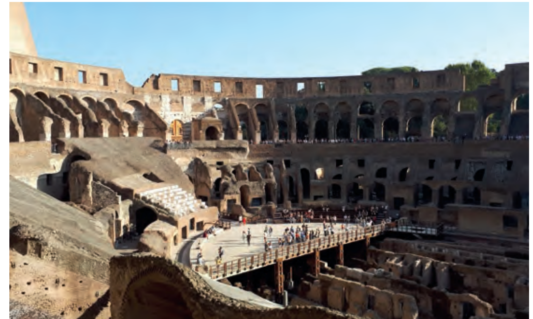
La visita al Coliseu era una de les més esperades pels nois

El dissabte el vam començar adreçant-nos a la Plaça de Sant Pere. A tocar de l'obelisc ens vam trobar amb el P. Abat i d'altres pelegrins que anaven al mateix lloc, i ens vam dirigir al control de seguretat. Teníem una