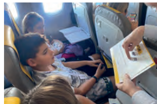
Una hostessa lliurant el diploma de primer vol a un dels escolans que feien l'experiència de volar per primera vegada