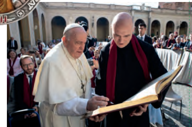
El Sant Pare signant el Llibre de la Confraria