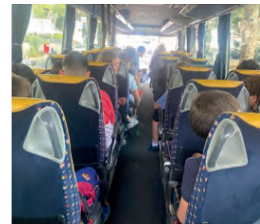
Els nois des de l'autocar escoltaven atentament les explicacions dels llocs per on anaven passant