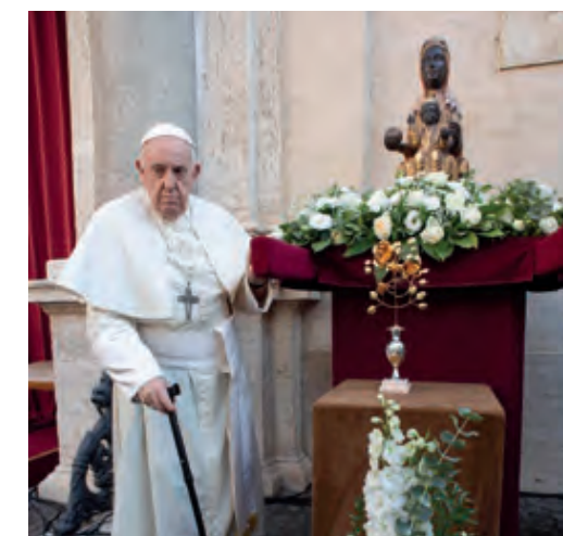
El Sant Pare amb la Rosa d'Or que acaba d'ofrenar a la Moreneta