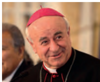
L'arquebisbe Paglia, un dels fundadors de la Comunitat de Sant'Egidi