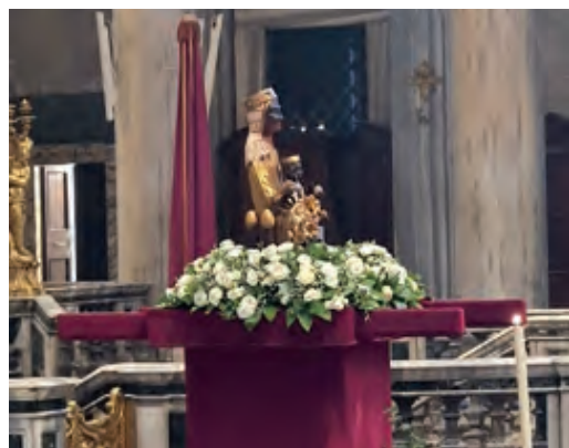
El darrer acte de la peregrinació, la Missa de Confreres Difunts a la Basílica de Santa Maria la Magiore.

Llobregat i Terrassa, juntament amb l'Hospitalitat de Girona, per dur a terme aquesta tasca, i a totes les persones que han fet possible que aquest pelegrinatge a Roma hagi sigut una experiència tan bonica, que m'ha omplert el cor de joia i de moments impressionants viscuts. No em vull allargar explicant el viatge de retorn de la Moreneta en ferri cap a Barcelona, ni els intrínquis per retornar tot el material i la imatge als seus llocs d'origen. Només dir-vos, com a Hospitalari de la Mare de Déu de Lourdes que soc, que va ser tot un honor per a mi ajudar l'Abadia de Montserrat en aquest pelegrinatge a Roma i dir-vos també que, per la Moreneta, sempre farem tot el que se'ns demani.