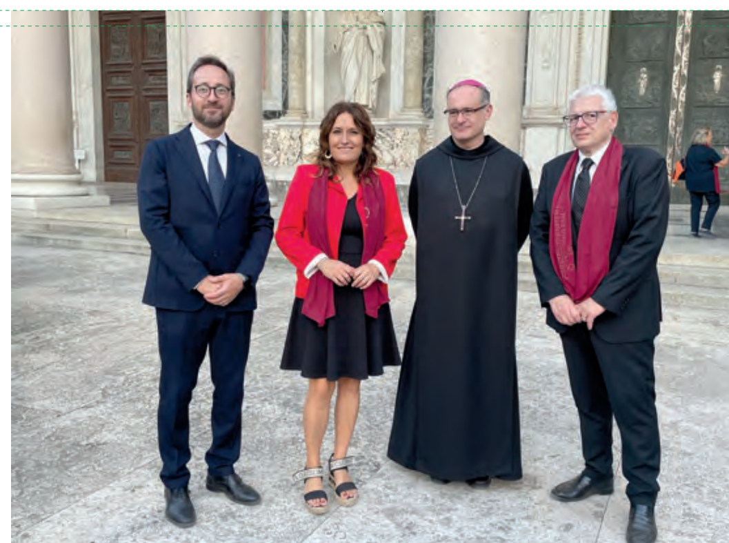
L'honorable Consellera Vilagrà amb el P. Abat i els altres representants institucionals el representant del Govern a Itàlia i el Director general d'Afers Religiosos

El monestir i els seus mil anys d'història són emblema de mil anys de cultura, llengua i identitat catalanes. I, en els temps convulsos que vivim, quan tot això sembla que es posa en qüestió, Montserrat manté inalterable l'estret lligam amb els catalans