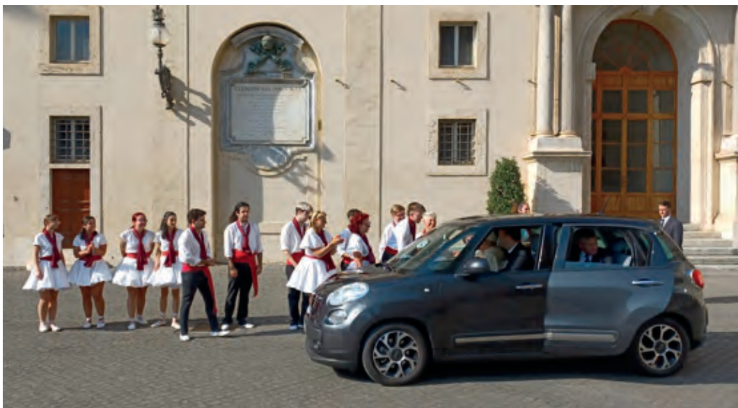
El Sant Pare va saludar els sardanistes des del seu cotxe tot aturant-se al seu costat