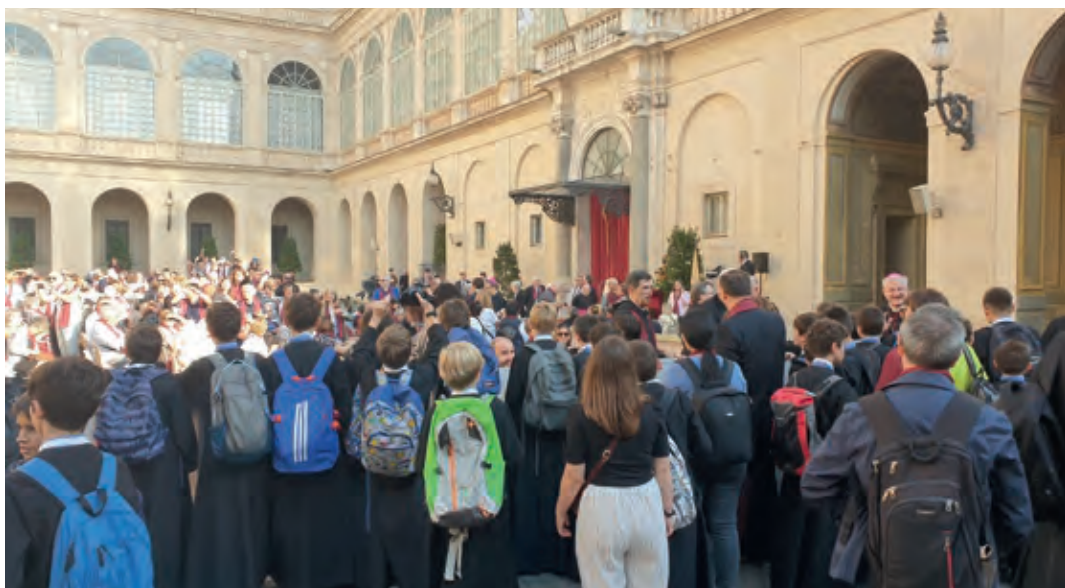
Cadascú tenia el seu lloc i hi va haver temps de comentar els actes del primer dia

serrat amb la imatge del "Llibre Vermell" de l'emperadriu de la ciutat joiosa que brilla en els mosaics magnífics de l'absis de la basílica del Trastevere.