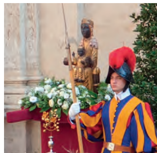
La imatge just després que el Sant Pare li oferís la Rosa d'Or

L'endemà al matí ens vam llevar molt d'hora. L'acte començava a les deu, però nosal-