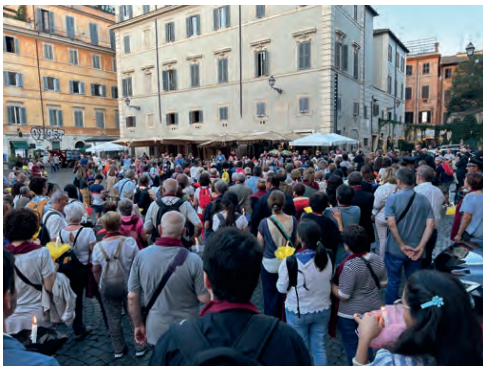
Rosari processional a la plaça de Santa Maria del Trastevere