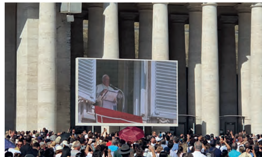
El Papa Francesc en l'oració de l'Àngelus

A l'Àngelus hi érem tots al voltant de la Mare de Déu esperant pregar amb el Sant Pare i escoltar el seu parlament, en el qual esmentà particularment alguns dels grups presents. A nosaltres, però, ja ens havia saludat personalment el dia anterior. Foren unes pa-