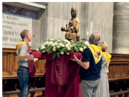
Tot preparant la imatge per la Missa de la Mare de Déu de Montserrat