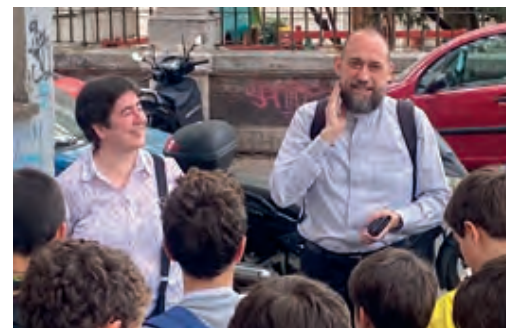
La Gna. Natàlia va ser una acompanyat de luxe pels seus coneixements de Roma on ha residit.