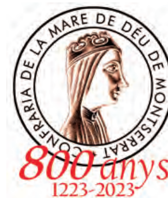
Logo de la commemoració dels 800 anys de la Confraria

El pelegrinatge a Roma de la Confraria de la Mare de Déu de Montserrat en motiu dels 800 anys, que es celebrà els dies 6, 7, 8 i 9 d'octubre, va aplegar més de 800 pelegrins que, de manera organitzada, viatjaren a la Ciutat Eterna per a participar de tots els actes i celebracions d'aquest esdeveniment, als quals es va unir també un gran nombre de confreres i devots de la Moreneta que, de casa estant, hi participaren amb la pregària i el seguiment de les diferents infomacions que es donaven diàriament a través de les webs de Montserrat i de l'Escolania. Tots vam poder iniciar ja dies abans aquest camí, amb una preparació que ajudava a prendre consciència del significat i el propòsit d'aquesta romeria.