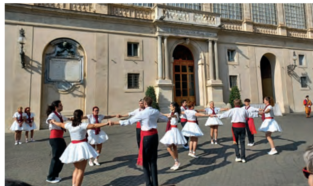
Estrena de la Sardana de la Pau al pati de Sant Damas del Palau Apostòlic

President de l'Obra del Ballet Popular Director de la cobla Ciutat de Granollers