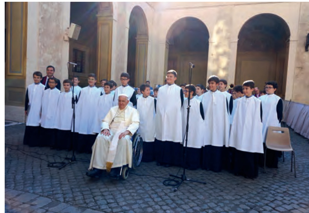
Una imatge simpàtica. El Sant Pare, després de saludar un per un els escolans, es va fer una fotografia amb ells.

Com que la Missa estava programada a les 13:30 h, perquè poguéssim tenir l'espai per a nosaltres sols, i la processó havia de començar un quart abans, ens va quedar una