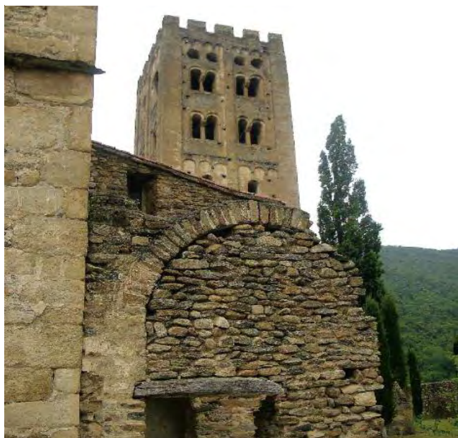
Monestir benedictí de Sant Miquel de Cuixà

L'assistència és validable per un crèdit de lliure elecció de la Universitat de Barcelona